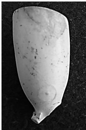
Afb. 7. Primitief zijmerk: muil gekroond. Afb. 8. Vage afdruk: wagenwiel.

Het is opmerkelijk dat ik na al die jaren pijpenkoprapen maar één gouwenaar met 18 als hielmerk heb gevonden. Het is een ovoïde model uit begin 19 e eeuw, met twee Goudse bijwapens. Toen ik echter het merk nauwkeuriger bekeek, bleek dat de 8 scheef stond en recht aan de achterkant. Het vraagstuk met betrekking tot de zeldzaamheid werd nu duidelijk, het is niet het cijfer 18, maar de letters IB. Zeer waarschijnlijk maakten pijpenmakers