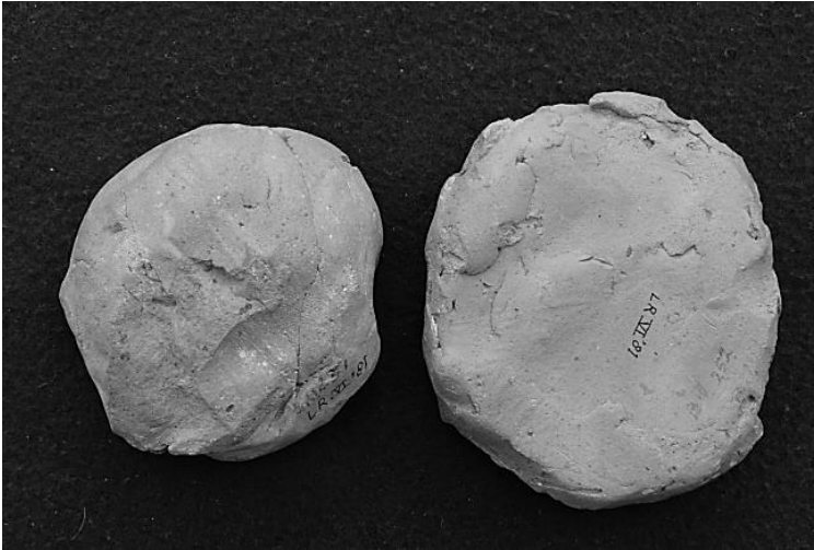
Afb. 1. Achterkant van de applique-mallen.

waarvan ik twee in bezit hield. 8 Met één exemplaar was ik bijzonder verguld, namelijk een gave mal met het wapen van Utrecht! De plak van rood aardewerk meet 87 bij 76 mm en is 18 mm dik. Op een afdruk is te zien hoe deze op aardewerk als reliëfversiering werd opgebracht. Twee staande, aankijkende leeuwen houden het Utrechtse stadswapen vast, dat is gedekt door een primitieve kroon (afb. 2a-b).