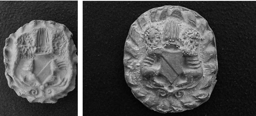
Afb. 2a. Applique-mal met afbeelding wapen van Utrecht. Afb. 2b. Afdruk van het wapen van Utrecht.