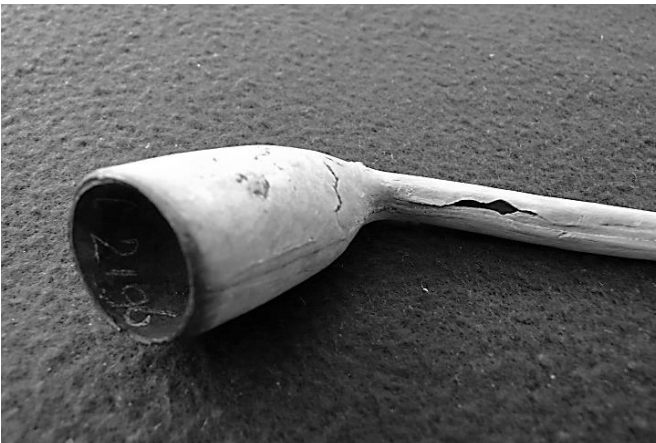
Afb. 5. Goed berookte pijp met lek in steel.

De trechtersvormige pijp was een korte en goedkope pijp en daarom vooral in trek bij rokers met een bescheiden beurs, waartoe veel inwoners van Lauwerecht behoorden. Zelfs tweede keus pijpen vonden hun weg naar de roker, getuige een vondst in de Noorderstroom in Lauwerecht van een goed doorgerookte pijp. Het rookkanaal is verkeerd gestoken en het ontstane lek bij het 'tremmen' weer gedicht (afb. 5).