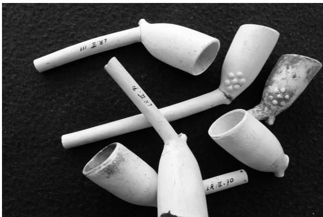
Ab. 4. Opgegraven pijpenkoppen.

Voor de andere mal, een brok rood gebakken klei van 72 bij 66 mm, bleek echter professionele belangstelling te zijn. Deze vondst werd zelfs, vanwege de bijzondere, religieuze voorstelling in een kleine tentoonstelling “Vrome vondsten”, in het Centraal Museum in Utrecht, opgenomen. In de catalogus beschreven als: ‘Rechts op de mal is Melchizedek afgebeeld als bisschop. Hij draagt op zijn ene hand een schaal met brood en een wijngkan. Zijn andere arm (de rechterraam op het afgietsel) heft hij, waarschijnlijk om Abraham te begroeten. Abraham staat tegenover hem en is uitgebeeld in een kort soldatentenuue. Hij begroet Melchizedek. Achter hem is een tweede soldaat weergegeven.’ 9 De mal werd waarschijnlijk niet meer of nooit gebruikt omdat deze beschadigd is. De stads-archeoloog dateert de mal in het tweede tot en met het derde kwart van de 17 e eeuw (afb. 3a-b).