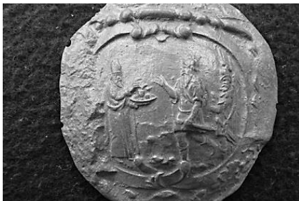
Afb. 3a. Applique-mal met religieuze voorstelling; Afb. 3b. Afdruk van de religieuze voorstelling.

Voor de andere mal, een brok rood gebakken klei van 72 bij 66 mm, bleek echter professionele belangstelling te zijn. Deze vondst werd zelfs, vanwege de bijzondere, religieuze voorstelling in een kleine tentoonstelling “Vrome vondsten”, in het Centraal Museum in Utrecht, opgenomen. In de catalogus beschreven als: ‘Rechts op de mal is Melchizedek afgebeeld als bisschop. Hij draagt op zijn ene hand een schaal met brood en een wijngkan. Zijn andere arm (de rechterraam op het afgietsel) heft hij, waarschijnlijk om Abraham te begroeten. Abraham staat tegenover hem en is uitgebeeld in een kort soldatentenuue. Hij begroet Melchizedek. Achter hem is een tweede soldaat weergegeven.’ 9 De mal werd waarschijnlijk niet meer of nooit gebruikt omdat deze beschadigd is. De stads-archeoloog dateert de mal in het tweede tot en met het derde kwart van de 17 e eeuw (afb. 3a-b).